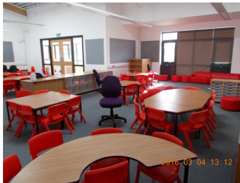
Winterbourne International Academy egyik tanterme

évek óta működtetett tanárképzési rendszert, amelynek két gyakorlati órájába a megbeszélés után bepillantást is nyerhettünk. E rendszer fontos eleme, hogy az iskolaszövetség tanárképzéséért felelős szakemberei és a tanárjelöltek nem havonta, hanem hetente találkoznak. Így a tanárjelöltek heti rendszerességgel számolnak be a képző intézmény számára tanítási tapasztalataikról. Egy ilyen délutánon vehettünk mi is részt, ahol az első óra során a tanárjelöltek megosztották egymással heti tanítási-nevelési tapasztalataikat, majd a következő hétre világosan megfogalmazott fejlődési célokat tűztek ki maguk számára. A második órán egy kutatási alapú project kidolgozásába kezdtek bele. Mivel a Cabbot Learning Federation nagyon erőteljesen alakítja nemcsak a gyakorlati képzést, hanem a tudományosat is, kívülállóként számunkra nagyon érezhető volt az egyetem képviselője és az iskolaszövetség között fennálló ellentét.