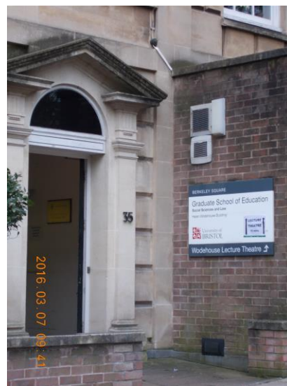
Graduate School of Education