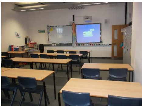
Backwell School egyik tanterme