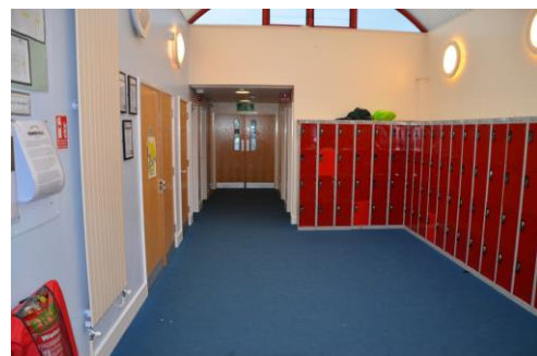
Katherine Lady Berkeley's School